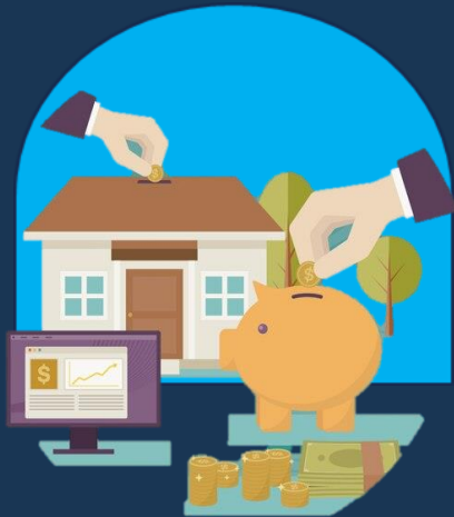
AGENZIE RECUPERO CREDITI